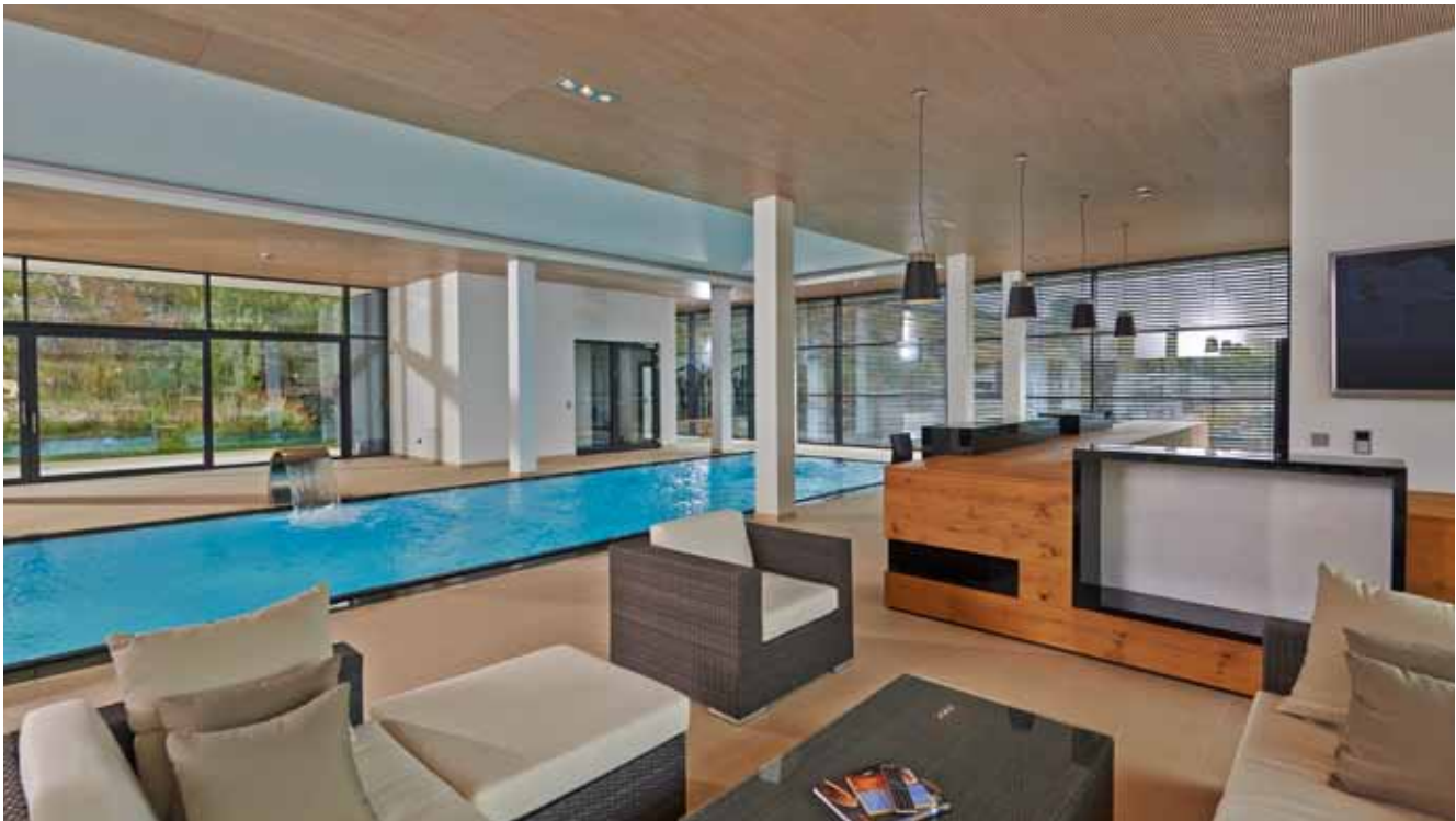
Die Schwimmhalle macht insgesamt einen wohnlichen einladenden Charakter, der schon durch die umfangreiche Ausstattung deutlich wird.

Der erste Eindruck: Wir haben uns in der Adresse geirrt. Denn von außen ist das Gebäude nur schwer als Wohnhaus zu identifizieren. Der Gebäudekomplex, vor dem wir stehen, ist Teil des Betriebsgelände eines mittelständischen Unternehmens mit Produktionshalle, Büros, Lager etc. Das kürzlich neu errichtete, an das Betriebsgelände angegliederte Wohnhaus wurde aber von dem Architekturbüro Gebhard in Blaubeuren architektonisch so gekonnt an die vorhandenen Gebäude angepasst, dass der Unterschied für den Laien nicht sichtbar ist. Das Gebäude umfasst immerhin fünf Stockwerke, wie Ospa-Fachberater Michael Honold erläutert. Im Erdgeschoss befinden sich die Garagen und im ersten Stockwerk Büroräume. Ein Stockwerk darüber wurde die komplette Etage für die Haus- und Schwimmbadtechnik ausgebaut. Und in der dritten Etage entstand der Wellnessbereich mit einem PVC-Schwimmbecken der Firma Vario Pool System. Das Becken steht aufgeständert im zweiten Stockwerk und ragt bis auf die dritte Ebene. So sind das Becken und die Ospa-Schwimmbadtechnik, die hier direkt am Beckenkörper installiert ist, leicht und